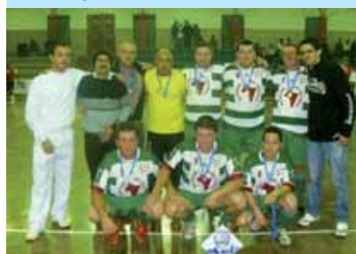
Equipe do Papo Seco - Vice-campeã

Foi realizado no mês de agosto a II Copa Master de Futebol, com a Presença de cinco times: Santa Terezinha, Papo Seco, Catanga, Pinheirinhos e Macota. O campeonato foi curto, porém muito disputa-