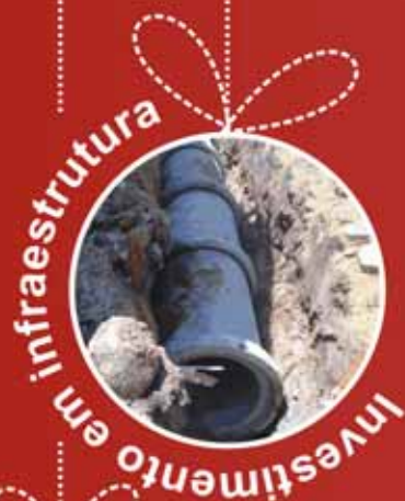
Investimento em infraestrutura

Passa Quatro encerrou o ano com diversos presentes dados à população