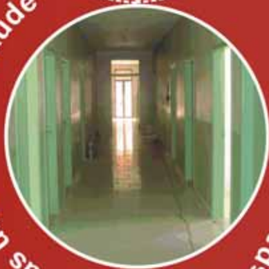
Novas unidades de Saúde