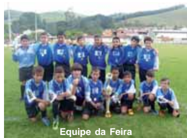
Equipe da Feira

Categoria sub-13: 1º lugar: Catanga, 2º lugar: São Geraldo e 3º lugar Pé do Morro.