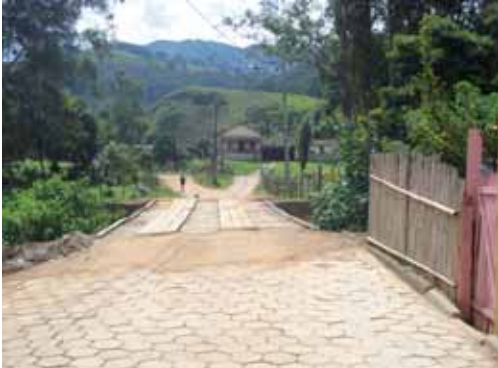
Rua Lourenço Guedes

Diversas Pontes foram reformadas. Um benefício tanto para os moradores que acessam pelo local quanto aos turistas que as utilizam na prática do Ecoturismo