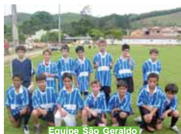
Equipe São Geraldo