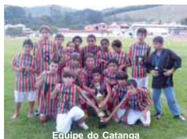
Equipe do Catanga