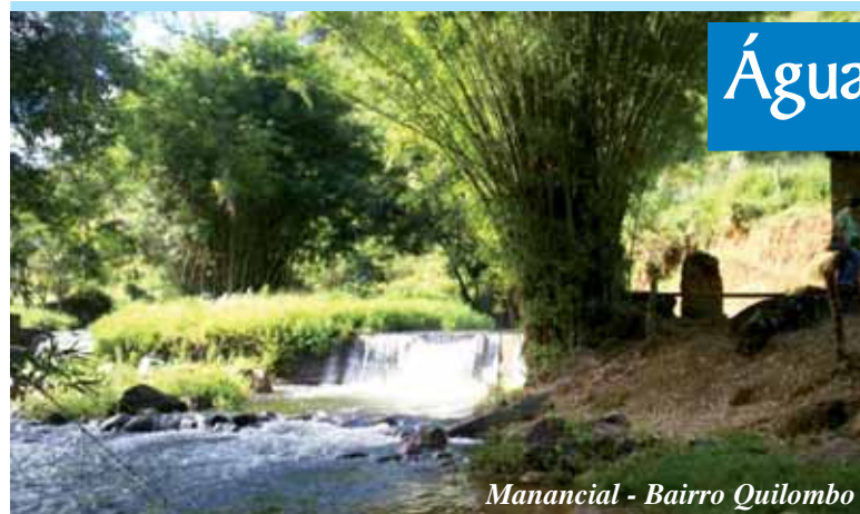
Manancial - Bairro Quilombo

A população dos bairros Tronqueiras, Pé do Morro, Copacabana, São Geraldo, Rio das Pedras, Grotta, São Francisco, Fazendinha, Mato Dentro, Barrinha que até o momento não são beneficiados com água tratada ou têm problemas com o fornecimento de água, em breve não sofrerão mais com estes problemas.