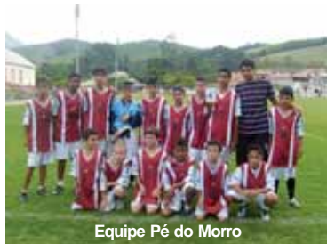
Equipe Pé do Morro