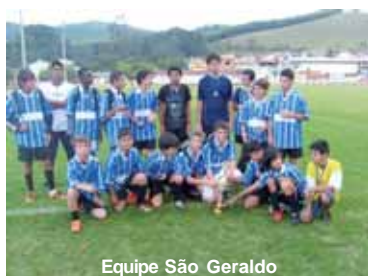
Equipe São Geraldo