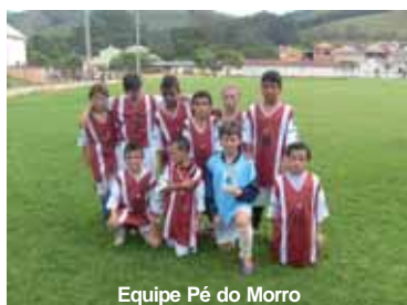
Equipe Pé do Morro