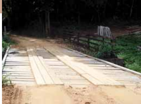
Estrada do Bairro do Morro