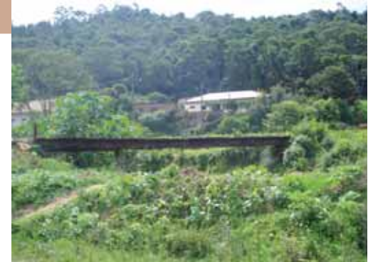
Estação do Manacá

Também foram reformadas as pontes dos Bairros Caxambu, Fazenda Velha e Serrinha